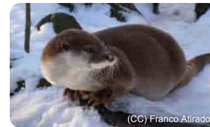
(CC) Franco Aitador

La loutre laisse des empreintes où les cinq doigts de chaque patte sont bien visibles. Les empreintes postérieures sont légèrement moins symétriques que les empreintes antérieures.