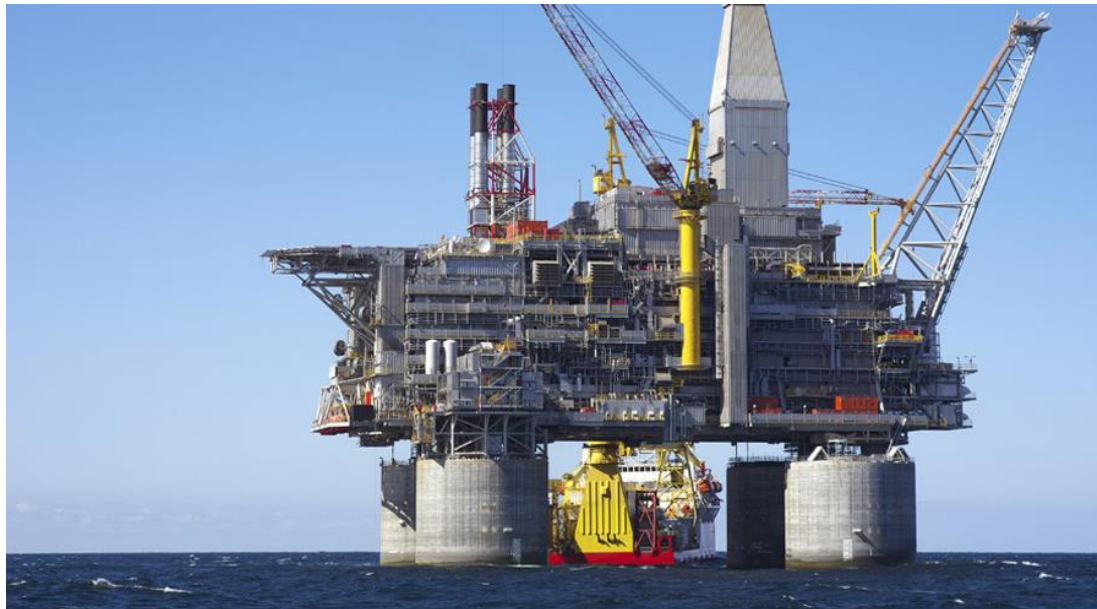
plate-forme pétrolière en mer