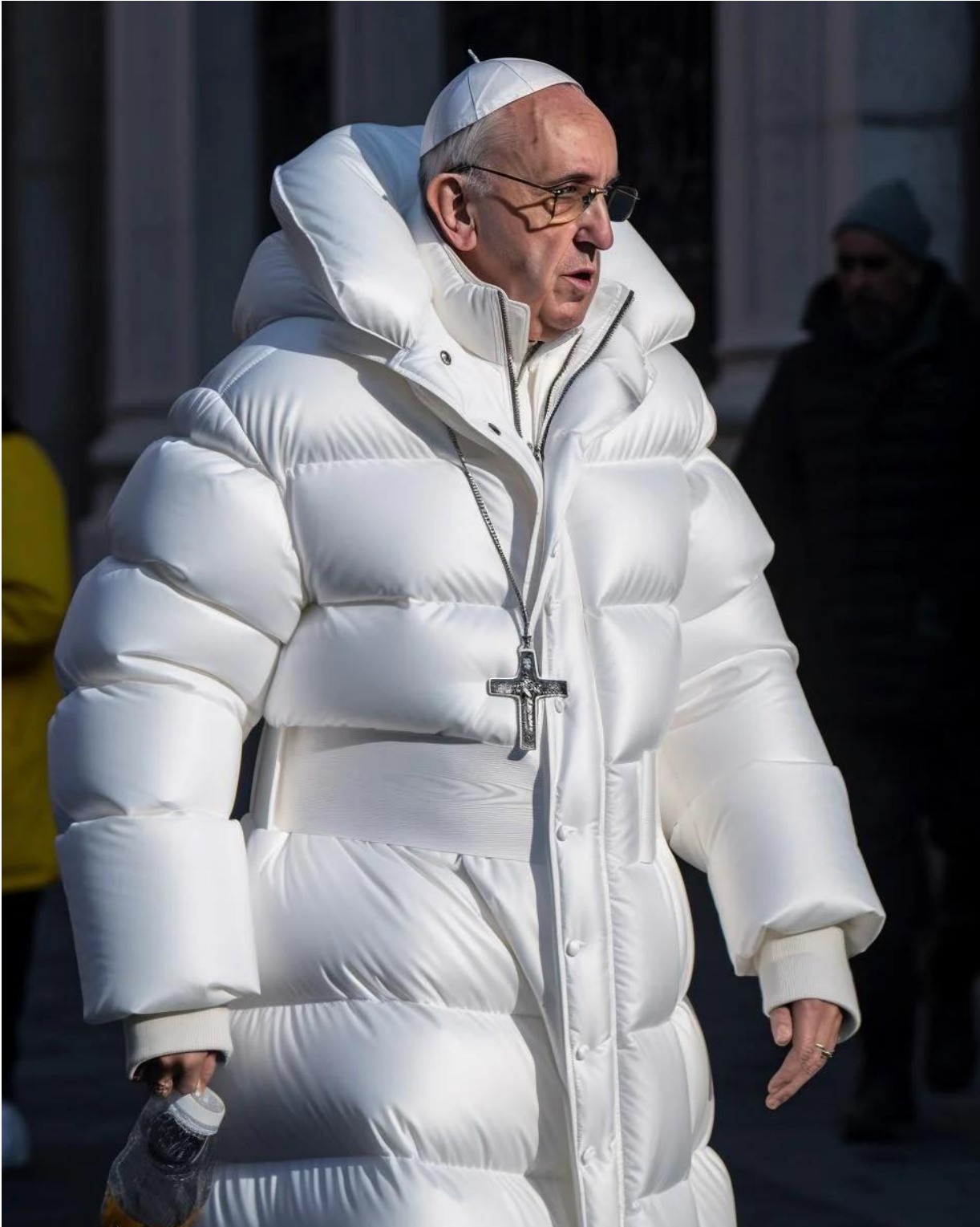
Image générée par l'IA reddit