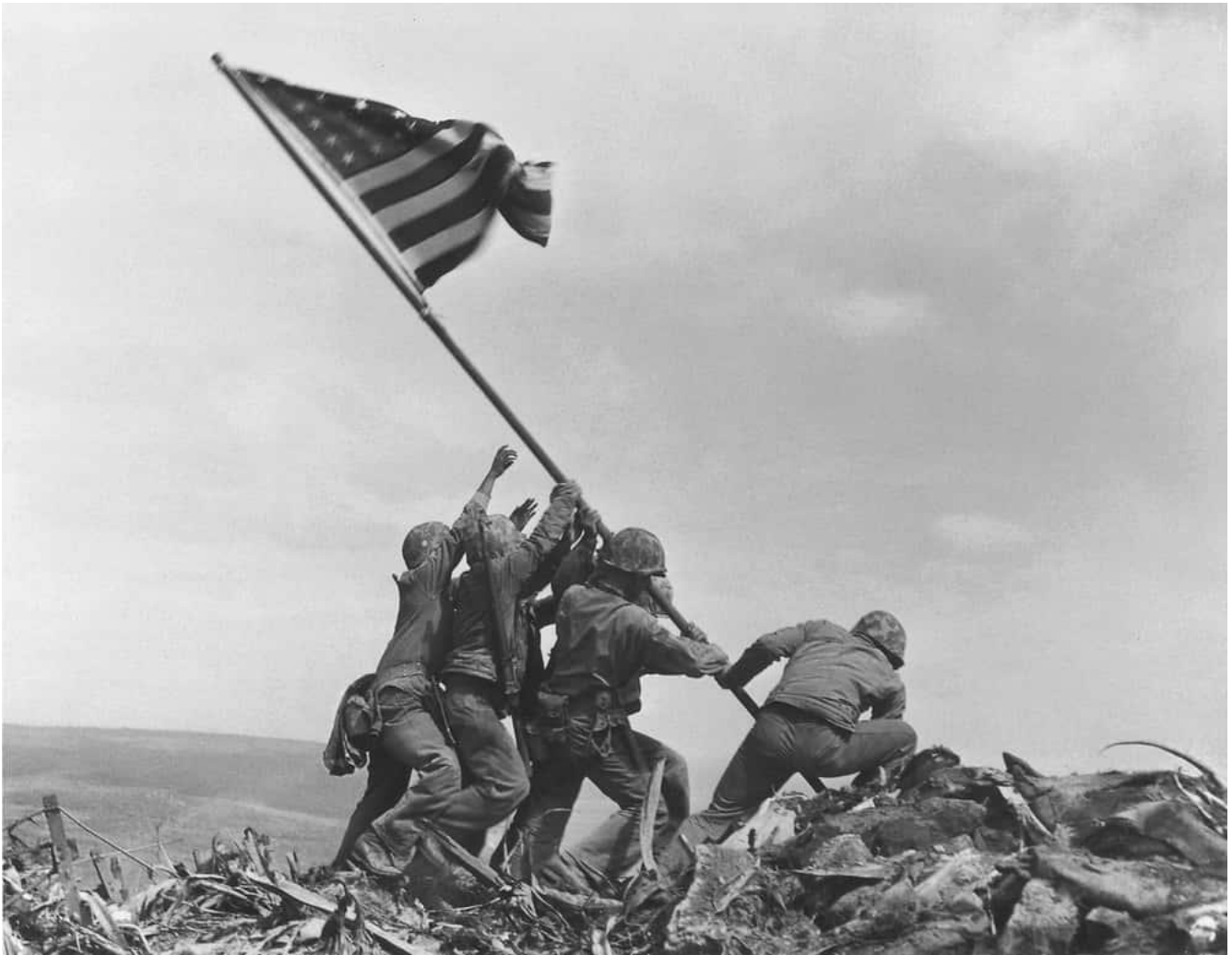
Recréé Joe Rosenthal, Public domain, via Wikimedia Commons