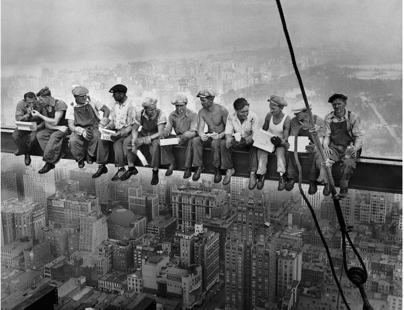
Mise en scène pour la publicité afin de promouvoir un nouveau bâtiment.